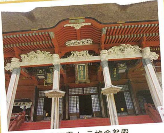
★★羽黒山 三神合祭殿