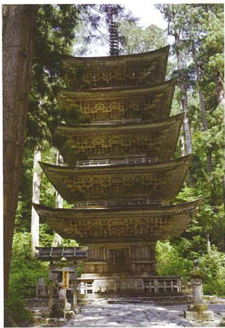
★★国宝 羽黒山五重塔