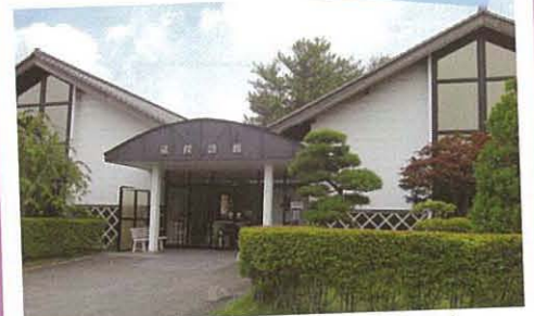
初孫酒造資料館「蔵探訪館」

庄内路の美しい風景と観光名所を 楽しむ日帰りツアーです。 歴史の面影残る味わい豊かな 庄内をゆっくりとご堪能下さい。